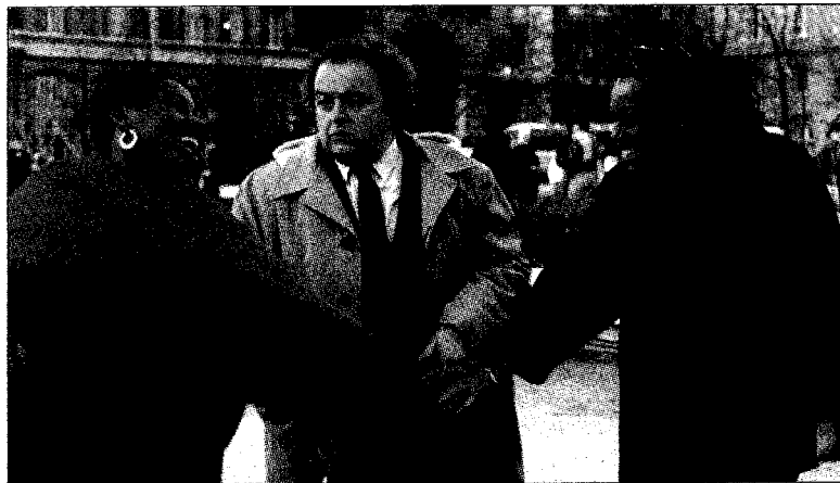
«Paris 18», unter anderem mit «Black Mic-Mac» (1985), einem Film von Gilou.