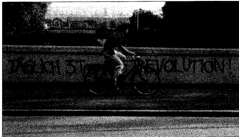
«Zürich 4», unter anderem mit «Filou» (1988), einem Dialektfilm von Samir.

Konzert mit dem Kinderchor «Les petits chanteurs de Barbés» aus der Goutte d'Or und einem ad-hoc Kinderchor des Hohlschulhauses, 19:30 h